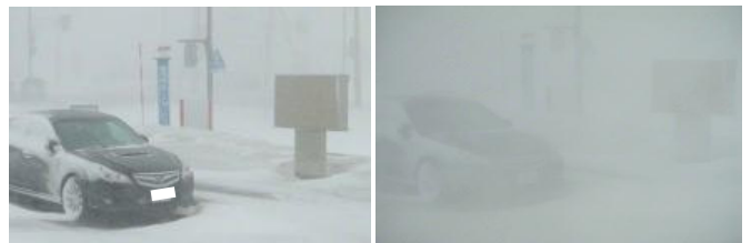
ぼうふうせつ 暴風雪であつという間にすぐ近くが見えなくなる (右) わかかないしない 稚内市内 (平成 24 年 4 月 4 日)