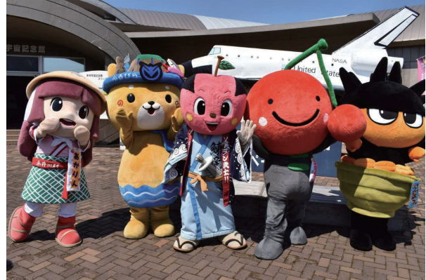
▲北しりべしのご当地キャラクター集合