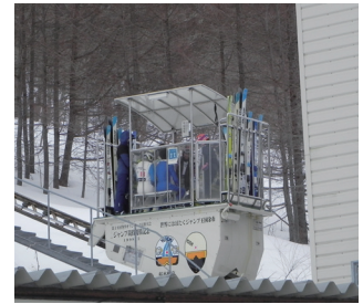
▲選手をスタート地点にはこぶスロープカー