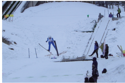
▲小学生の見事なジャンプ

大会には小・中・高校生の部に3大会合わせて約100名（余市町16名）が出席し、日頃の練習の成果を競い合いました