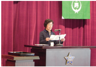
▲学生代表による答辞

続けて、学生自治会の交流会が行われ、和やかな雰囲気でもレクリエーションを楽しみました。