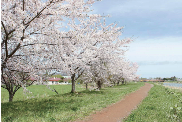
▲満開の余市川桜づつみ