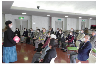
▲自治会交流会風景