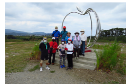
▲りんごオブジェの前で