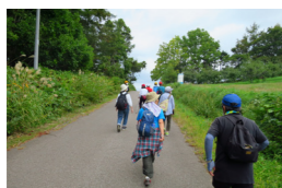
▲風景を楽しみながら

前期は雨のため中止となりましたが、今回は余市町登市民農園がスタート・ゴールの約7kmのコースを2時間程かけて歩きました。コース周辺は果物畑が多く、実りの秋を感じながら歩き終えました。