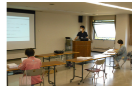
▲操作方法を学ぶ受講生

受講生は最初に設定や基本操作を学んだ後、ネット検索の仕方や写真・動画撮影の方法など幅広い操作方法を学びました。