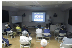
▲縄文遺跡について学ぶ受講生

余市町にある貴重な遺跡(フゴッペ洞窟など)との繋がり等について学ぶことができました。