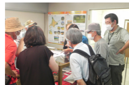
▲土器・石器を手に取って