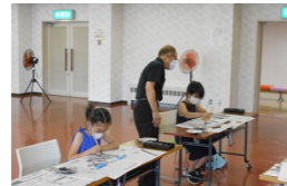
▲筆づかいの基本練習を