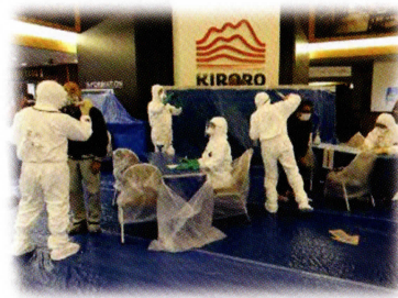
原子力災害医療活動訓練 (避難退域時検査)