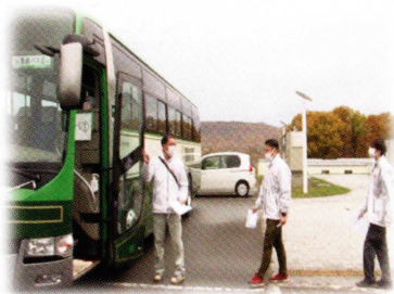
住民避難訓練 (バスによる避難)