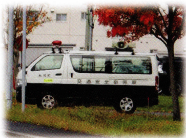
広報訓練 (広報車による広報)