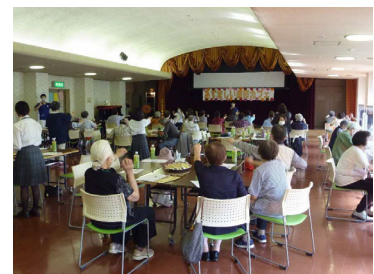
▲前回開催した「あずましい余市カフェ」の様子