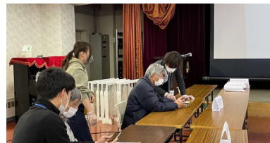
◀昨年のスマホ教室の様子

申込み・問合せ 余市町社会福祉協議会 ☎22-3156 保険課 介護保険グループ ☎21-2119