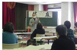
▲太筆の使い方を学習

書初め作品の文字は横書きの『健康』。そして「健」と「康」の間には「何よりも心を尽くして学び続ける一年でありたい 貴方も私も」という願いの文も書き入れました。書き終えた受講生からは、達成感に満ちた表情が感じられました。