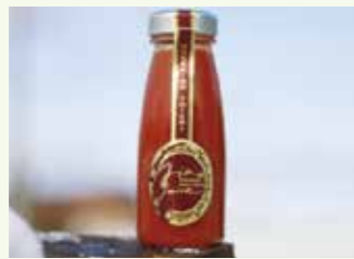
プレミアムアイコ 180ml

超完熟した余市産の果汁が少ないミニトマト「アイコ」を使ったジュース。「甘いね」ではなく「おいしいね」と思わずなる味わいです。