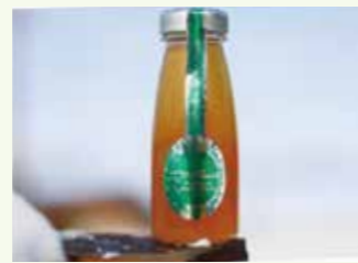
プレミアムポर्टランド 180ml

通常よりも選抜みした白ぶどう「ポर्टランド」を使用。他の品種よりも酸味が弱く、甘さの際立つぶどうなので、お子様にも大人気です。