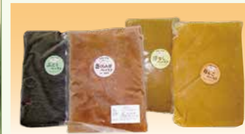
フルーツペースト(ぶどう、さくらんぼ、洋なし、りんご) 1kg×10袋(1ロット)

余市産の果実に熱を加えて水分を除去した、無添加・無調整のペーストです。-40℃ほどで冷凍しています。開封後は冷凍庫で保存し、解凍後はなるべく早くご使用ください。