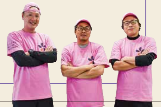
お揃いのTシャツをつくり 「余市ムール」を盛り上げる 余市町の漁師さんたち