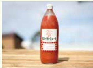
はじめちゃんのミニトマトジュース 1000ml

完熟したミニトマトを贅沢に使用したジュース。甘さと酸味のバランスが抜群で、トマト好きにはたまりません。