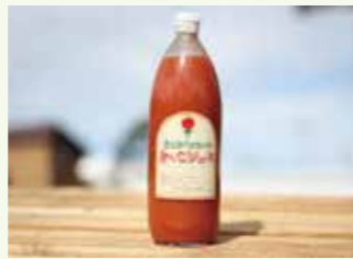
はじめちゃんのあいこジュース 1000ml

「アイコ」を使用し、甘さが際立つ味わいに仕上げました。トマトが苦手な人でも飲みやすいジュースです。