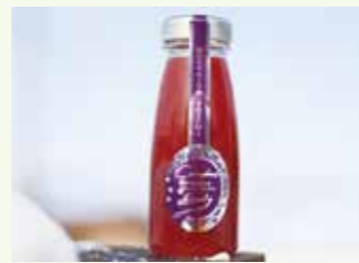
プレミアムキャンベル・アーリー 180ml

通常よりも選抜みした黒ぶどう「キャンベル・アーリー」を使用。ワインのような味わいですが甘くまるやか。芳醇な大人のジュースです。