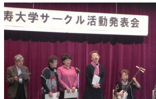
▲サークル活動発表会風景