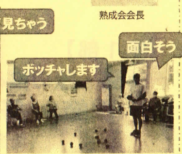
面白そう (Looks fun)

保健推進委員会は「健康で安心して暮らせる町づくり」の推進を目的に、各区会から推薦された委員により地域で健康学習会などの活動を行っています。