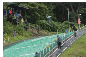
▲ジャンプ大会風景

「第24回余市町全日本ジュニアサマージャンプ大会」は、7月31日(月)に竹鶴ジャンツェで開催され、小・中・高の男女各部門に63名の選手が出場しました。大会には、余市・札幌・上川・下川のジャンプスポーツ少年団のほかに、新潟県・長野県・岩手県・青森県からも選手が参加し、日頃の練習の成果を競い合いました。