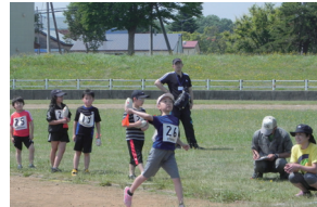
▲小学生ジャベリックボール投げ

競技会では、トラック競技の短・中距離走やリレー、フィールド競技のジャベリックボール投げ・走り幅跳びが実施されました。当日は気温が高かったので、選手の皆さんは体調管理に気をつけながら力いっぱい頑張っていました。