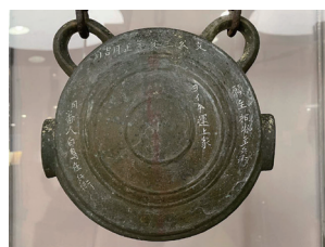
▲ 写真：鰐口 よいち水産博物館蔵

明治2（1869）年には、伊藤清之助さんという杵夫（山に入って木をきる人）が小峠橋近くの砥の川に通ずる道端で、旅人を泊める宿を営んでいたため、明治以降も山道としての機能は保たれていたようです。