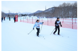
▲ クロスカントリー競技

2月5日(日)、第55回余市町民スキー大会兼第39回余市スキーマラソン大会は、ジャンプ台周辺の特設スラロームコースとクロスカントリースキーコースで、ジャイアントスラローム・スノーボード・クロスカントリーの競技が行われました。