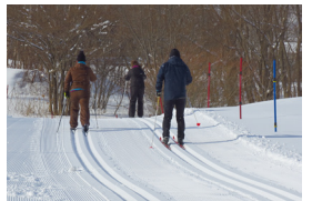
▲ 自分のペースで滑走

参加者は、冬期間の健康・体力づくり、運動不足の解消にと雪上スポーツを楽しんでいました。