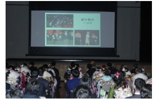
▲スライドショーの上映