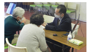
▲ベジチェック測定中