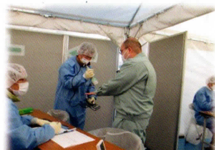
原子力災害医療活動訓練 （避難退域時検査）