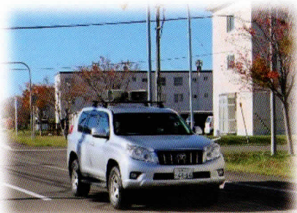
広報訓練 （広報車による広報）