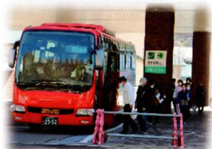
住民避難等訓練 （バスによる避難）