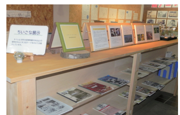
▲ちいさな展示コーナー