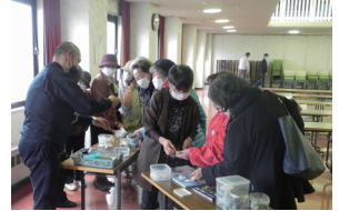
▲ 美しい貝殻等を観賞