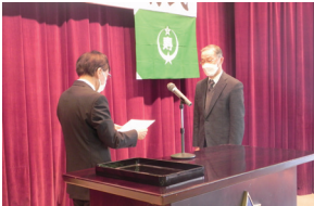
▲ 学生認定証の授与

今年度も健康・音楽・見学・安全などのテーマで12回の講座を実施し、4つのサークル(詩吟・民謡・カラオケ・歌声)も毎月2回活動します。