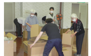
▲ ダンボールベッドの組立

講師 余市町総務課職員 参加対象 町内に在住されている方 定員 20名(定員になり次第締切ります) 申込方法 6月23日(金)までに中央公民館窓口または電話で申込みください。 (氏名、住所、連絡先をお伺いします。) 申込先 教育委員会社会教育課(中央公民館内) 大川町4丁目143番地 ☎23-5001