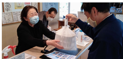
町内の官公庁や事業者が「助け愛テイクアウト」を利用