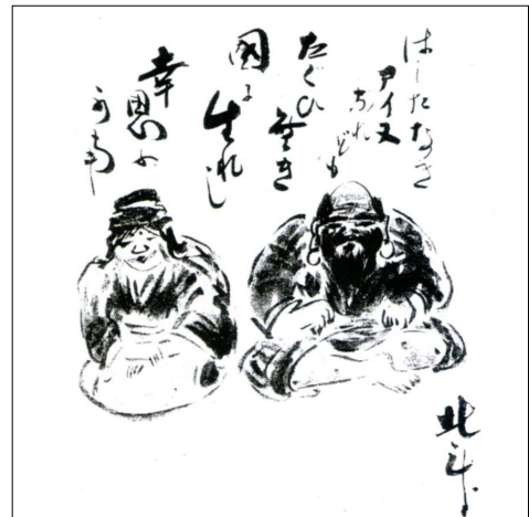
▲ 図 北斗の自筆