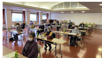
▲寿大学閉講式風景

令和2年度はともに、新型コロナウイルス感染症の影響で例年より3ヶ月遅れの7月スタートとなりましたが、感染対策をしっかりとり、細心の注意を払って参加していただいたので無事終わることができました。