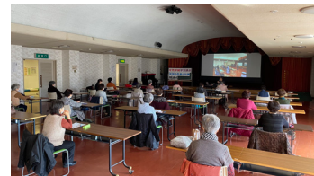
▲女性学級学習講座風景