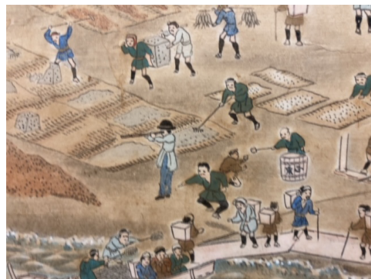
▲ 図：洋装の親方（中央）「湯内漁場盛業鳥観図」（部分、余市町指定文化財）

一例として、明治40年代の余市郡内の定置網経営者で『小樽区外七郡案内』に紹介されている13名の出身地をあげると、上ノ国出身者は4名、江差（五勝手ほか）は4名、青森県2名、新潟1名、松前1名、不明1名の内訳になっています。ニシン漁の親方の誕生は、沖揚音頭が発生した幕末頃ではなく、番屋建築を建てて、地域に貢献しうる実力を兼ね備えた明治20年代以降と言えそうです。