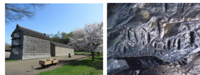
▲福原漁場とフゴッペ洞窟

昨年度は、フゴッペ洞窟の内部と福原漁場の石蔵が閉鎖となっておりましたが、新たに換気システムが導入されたので、今年度よりまた皆さんにご見学いただくことができます。ただし、歴史民俗資料館は引き続き閉鎖となります。これに伴い、博物館2階では歴史民俗資料館内で展示されていた考古資料が場所を移動して展示されます。こちらは大幅に展示替えが行われ、これまで以上に楽しめる考古展示としてリニューアルされましたのでぜひご覧ください。