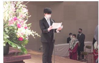
▲ 感謝の気持ちや決意を述べる新成人代表