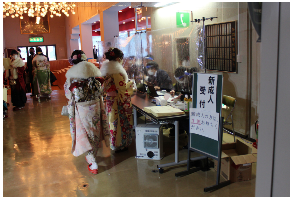
▲ 写真：詳細は14ページをご覧ください