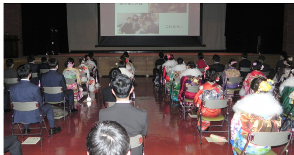
◀ 上映会風景 スライドショー