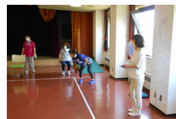
▲狙いを定めて円盤を投球!