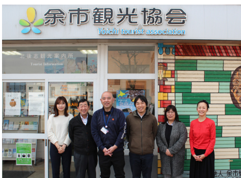
▲余市観光協会のスタッフと