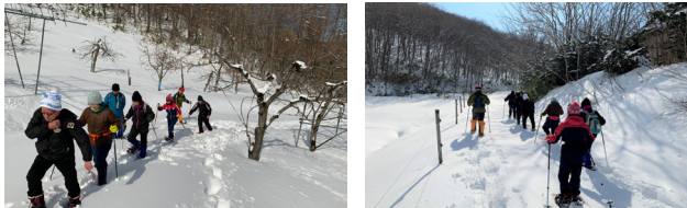
▲一歩一歩“かんじき歩き”で!

参加者の中にはかんじきを履いて雪原を歩くのは初めてという方もいましたが、普段よりも少し高く足をあげて、桐谷峠付近を1時間半ほどゆっくり歩き、かんじきならではの雪の感触を楽しみました。雪上にはウサギヤリスが駆け回った足跡もあり、自然の魅力を感じる教室となりました。