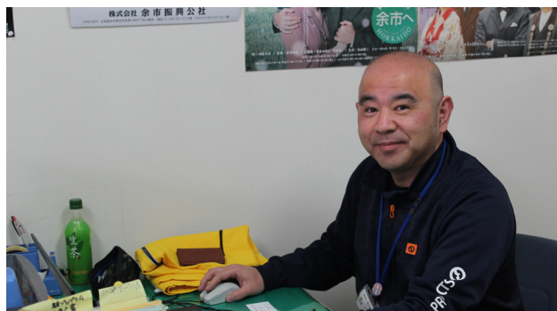
▲余市観光協会の一員としてがんばります。